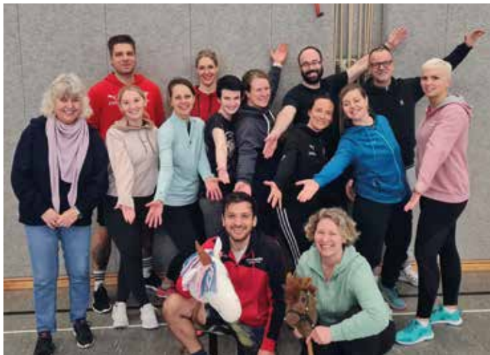
19 neue Übungsleiter für den Vereinssport.

(cn/jw) Der KSV Pinneberg war im letzten Jahr erfolgreicher Bildungsort für seine Mitgliedsvereine. Drei Aufgabenfelder Ausbildung, Fortbildung und Inhouse-Schulungen bilden die Grundlage der Ausbildungsvielfalt im Sport in der Erwachsenenbildung als auch in der Qualifizierung von Jugendlichen. Angeboten wurden Themen aus der Sportpraxis, dem Vereinsmanagement und sportartübergreifende Themen. In 2023 Jahr haben 12 Teilnehmerinnen und Teilnehmer den Grundkurs der DOSB C-Lizenz erfolgreich absolviert. Dieser bietet als erster Einstieg bereits eine sehr gute Möglichkeit, um im Verein eine Aufgabe im Ehrenamt zu übernehmen. Die komplette C-Lizenzausbildung mit dem Schwerpunkt „Breiten und Freizeitsport“ haben 19 Teilnehmerinnen und Teilnehmer mit Freude und Spaß erfolgreich abgeschlossen und die C- Lizenz erhalten. Wir wünschen den frischgebackenen Trainerinnen und Trainern viel Spaß bei der Vereinsarbeit. Ein großer Dank geht an das kompetente Lehrteam, das wieder sehr flexibel war und seit Jahren eine qualitativ hochwertige Arbeit leistet.