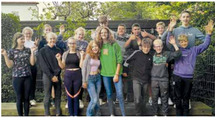
Die ganz jungen Hoffnungsträger der Vereine beim Jugendleiterassistentenlehrgang der Sportjugend des KSV Pinneberg